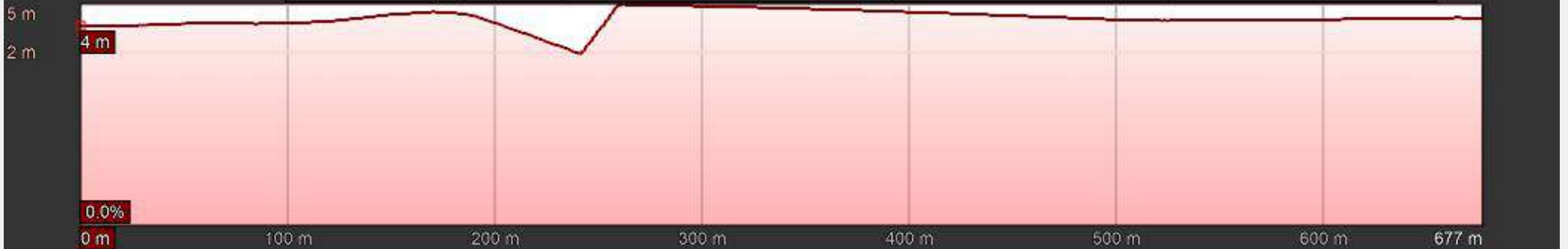
Gráfico: min., media, máx. Elevación: 2, 4, 5 m Total de intervalo: Distancia: 677 m Incremento/pérdida de elevación: 4.40 m, -3.92 m Pendiente máxima: 18.6%, -5.4% Pendiente media: 1.4%, -0.9%