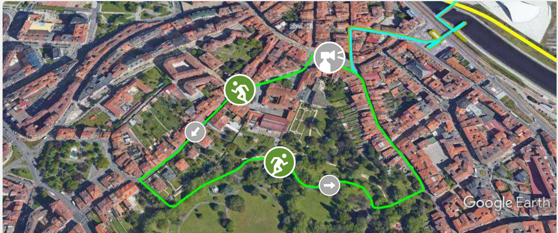
Gráfico: min., media, máx. Elevación: 15, 22, 29 m Total de intervalo: Distancia: 1,23 km Incremento/pérdida de elevación: 34,4 m, -34,6 m Pendiente máxima: 53,3%, -22,8%