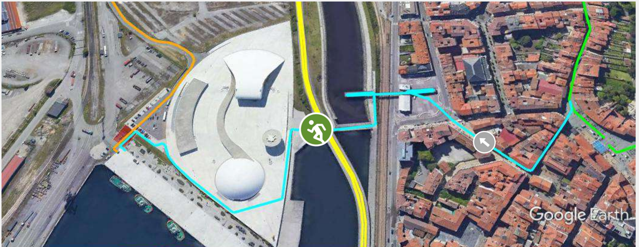
Gráfico: min., media, máx. Elevación: 3. 6. 17 m Total de intervalo: Distancia: 959 m Incremento/pérdida de elevación: 4.17 m. -16.4 m Pendiente máxima: 8.0%, -9.4% Pendiente media: 0.8%, -3.4%